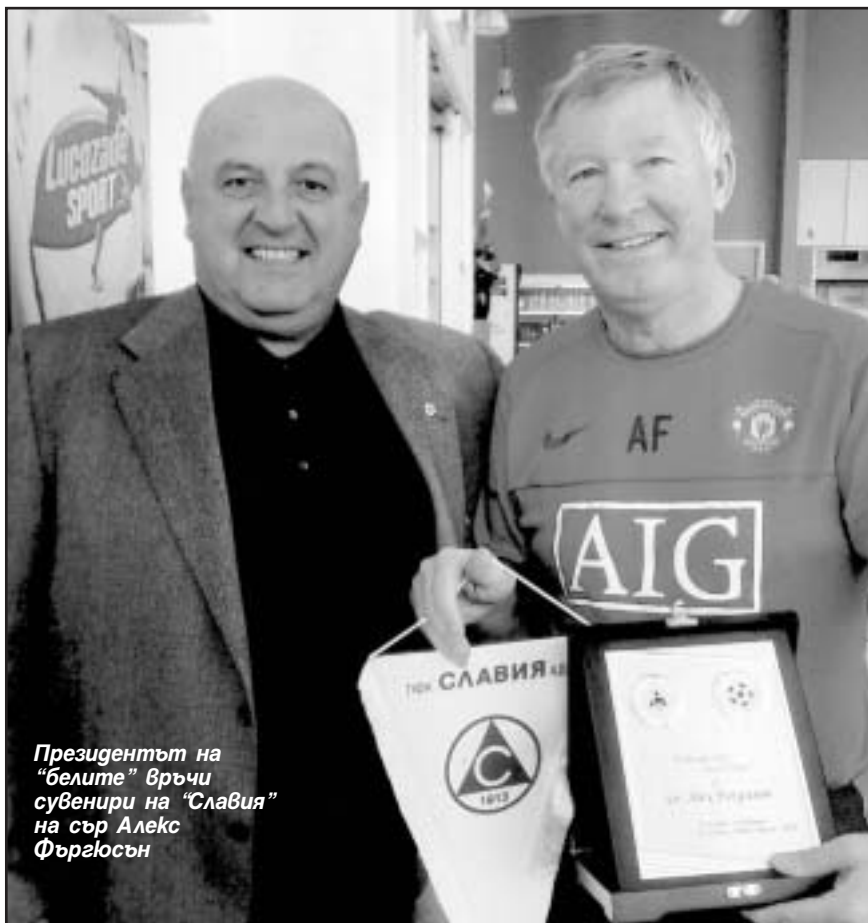
Президентът на “белите” връчи сувенири на “Славия” на сър Алекс Фъргюсън

Юноши на “белите” ще играят в турнири на “Олд Траффорд”