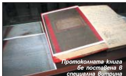
Протоколната книга бе поставена в специална витрина

Но да се върнем на откритването на книгат. Въпросният бизнесмен е закупил две стари софийски къщи и негови служители са открили протоколната книга на “Славия” на тавана на едната от тях. След като вижда, че има заинтересовани хора, които милеят за историята на “белия” клуб, взима решение да я предложи на ръководството. Не е тайна и не е срамно да признаем, че книгата беше откупена срещу немалка сума от ПФК “Славия” в лицето на неговия президент Венцеслав Стефанов. Наистина сумата е много голяма, но за мен този документ е безценен. В него се съхранява историята на “Славия” и цялата дейност на мозъчния тръст на клуба от първите години на създаването му. Именно заради това този документ е толкова ценен.”