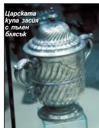
Царската купа засия с пясък