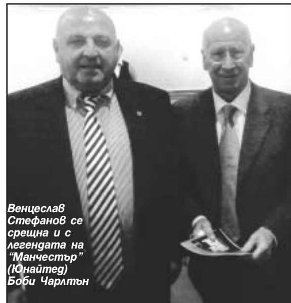
Венцеслав Стефанов се срещна и с легендата на “Манчестър” (Юнайтед) Боби Чарлтън