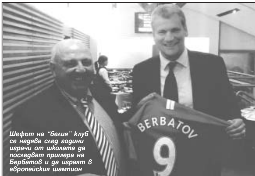
Шефът на “белия” клуб се надява след години играчи от школата да последват примера на Бербагов и да играят в европейския шампион